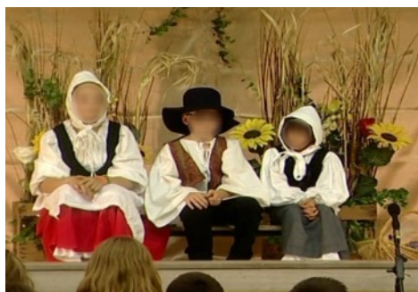
« Le chapeau du roi Pétrus » par les jeunes du SESSAD