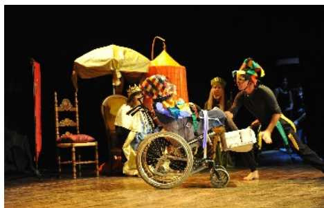
« Petite musique de pluie » par l'Institut Tony Lainé

■ En début d'après-midi, présentation des réalisations (peintures, sculptures, collages ...) et de spectacles réalisés par les jeunes des établissements.