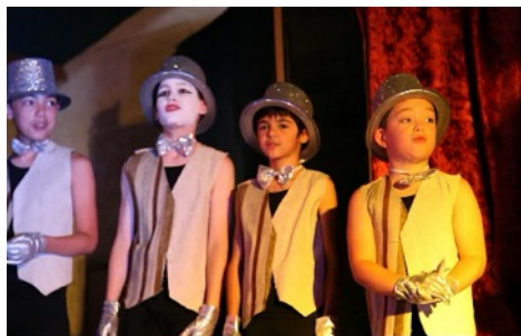
L'ITEP a présenté son spectacle « Cabaret »