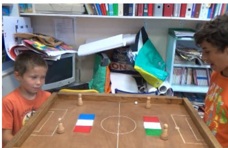
Les Lavandes, présentation d'un jeu à l'école de Laragne