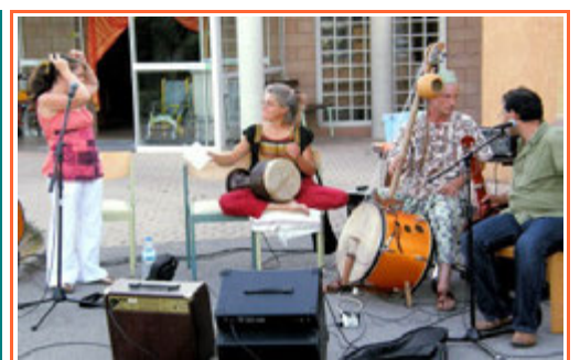
Le groupe « Assirem » Fameux le couscous !!!