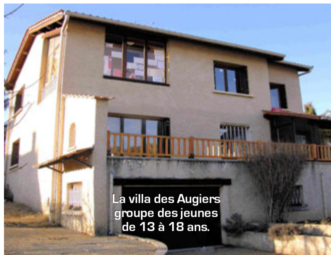
La villa des Augiers groupe des jeunes de 13 à 18 ans.